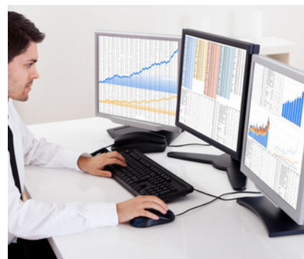
Der Statistikbeauftragte profitiert davon, dass die Studierenden ihre Daten selbst eingeben und TraiNex die Codierung übernimmt.

Später, bei Studienbeginn bekommt der Studienanfänger im TraiNex auf der Startseite präsentiert, welche seiner wichtigen Stammdaten bereits für seine Person hinterlegt sind. Der Studierende wird innerhalb der ersten Studienwoche amtlich aufgerufen, diese Daten im TraiNex zu prüfen. Falls Stammdaten sich seit der Bewerbung geändert haben oder falsche Stammdaten hinterlegt wurden, dann hat der Studierende die Möglichkeit, diese Fehler zu korrigieren und eine Änderung der Stamm-