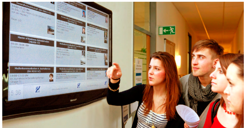
Freundlicher Empfang an der Fachhochschule des Mittelstands (FHM): Minutengenau werden die Daten für den Infoscreen aus dem TraiNex generiert

angesetzt sind und wo kurzfristige Änderungen, zum Beispiel bei der Raumplanung, vorgenommen wurden. Der Infoscreen sorgt auch für den freundlichen Empfang von externen Besuchern, die begrüßt und mit Orientierungshinweisen versorgt werden können. [AK]