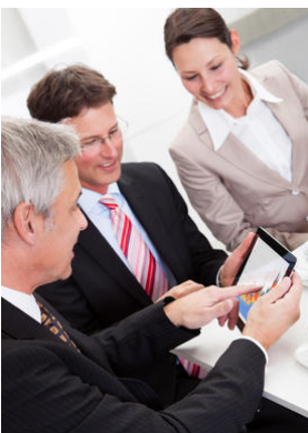
Grafisch-farbliche Auswertung ermöglichen auch ad-hoc-Auswertungen. Stärken und Verbesserungspotentiale der Lehrenden werden klar aufgezeigt.