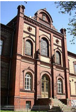
Eingang der Fachhochschule